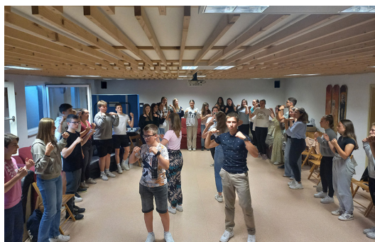
Srečanje oratorijskih animatorjev