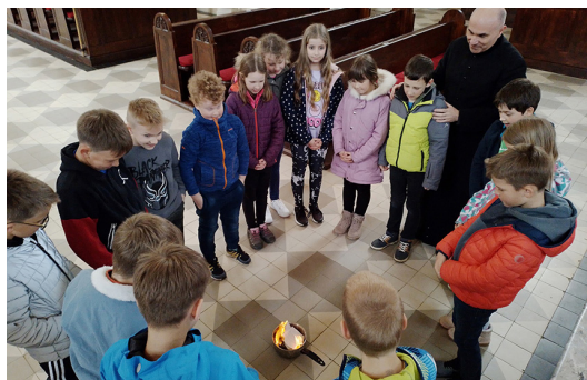
Prva sveta spoved