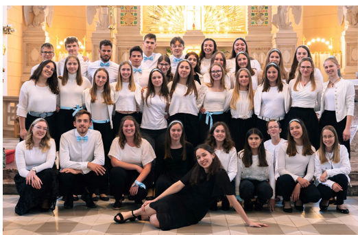
Cerkveni mešani mladinski pevski zbor Tvoj glas